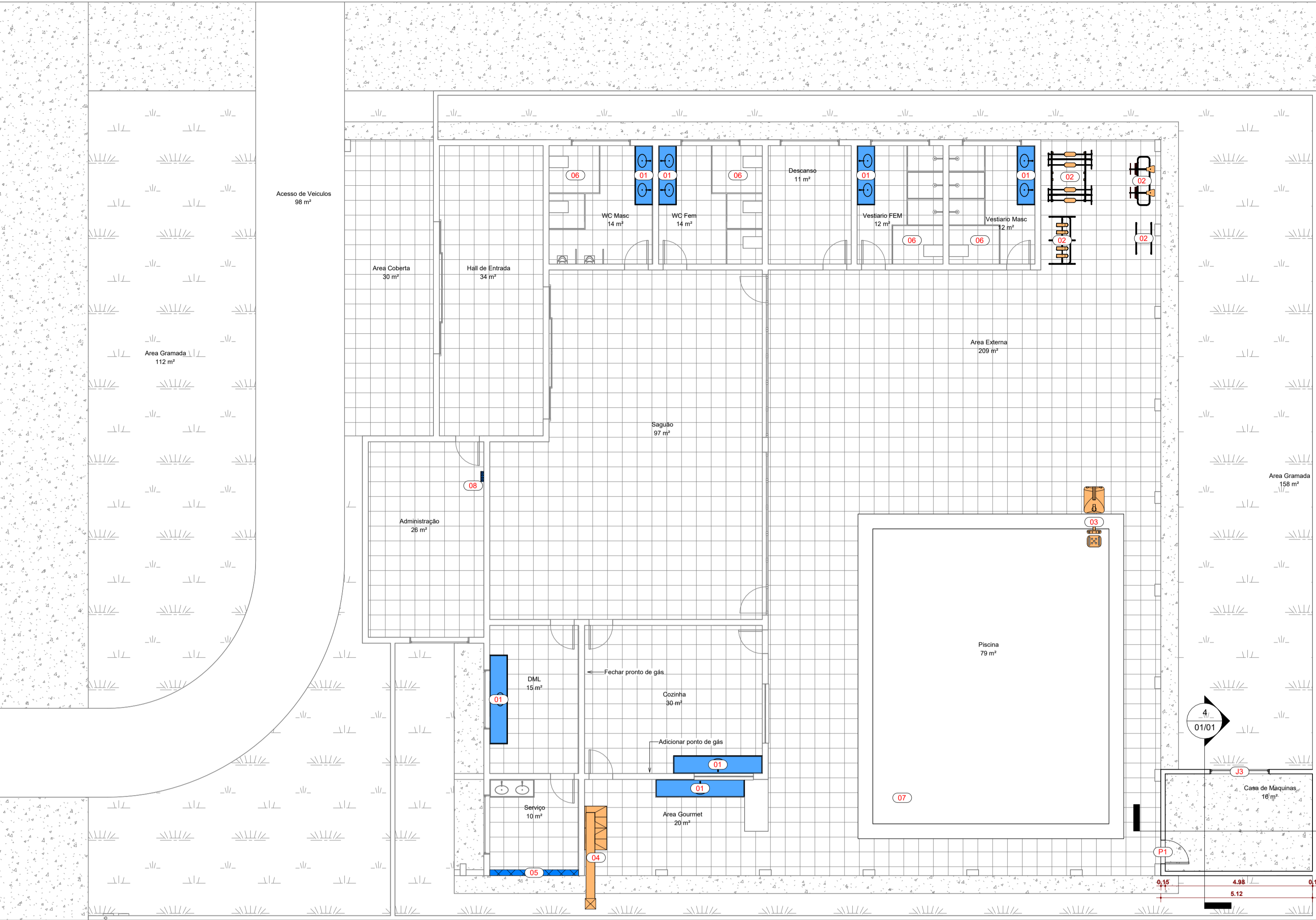
1 Planta Baixa 1 : 100